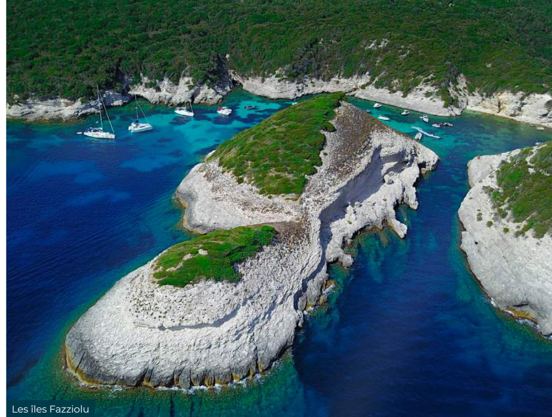
Les îles Fazziolu