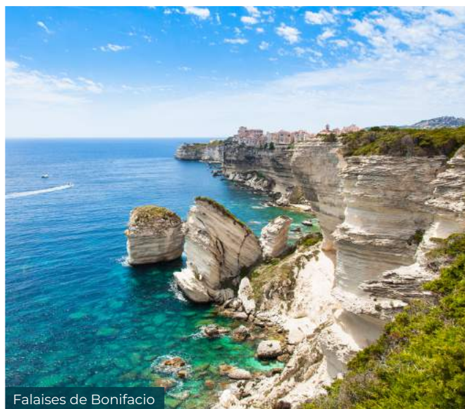
Falaises de Bonifacio