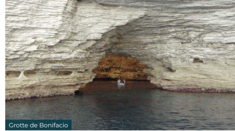
Grotte de Bonifacio