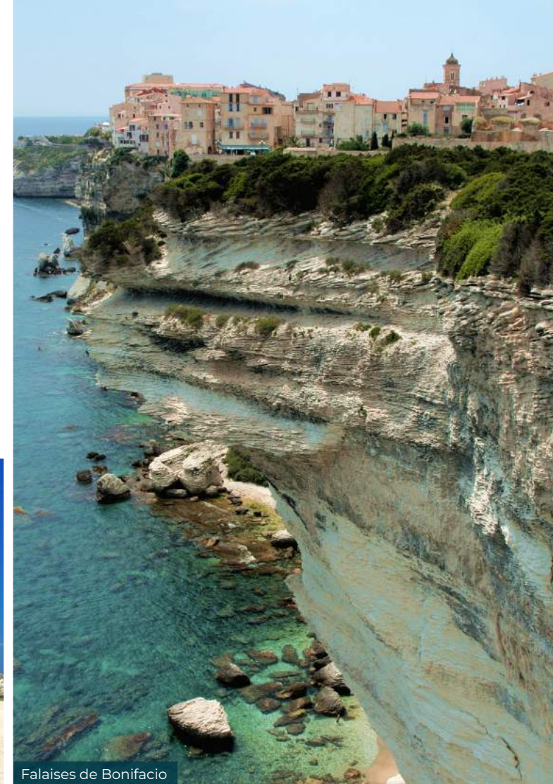
Falaises de Bonifacio