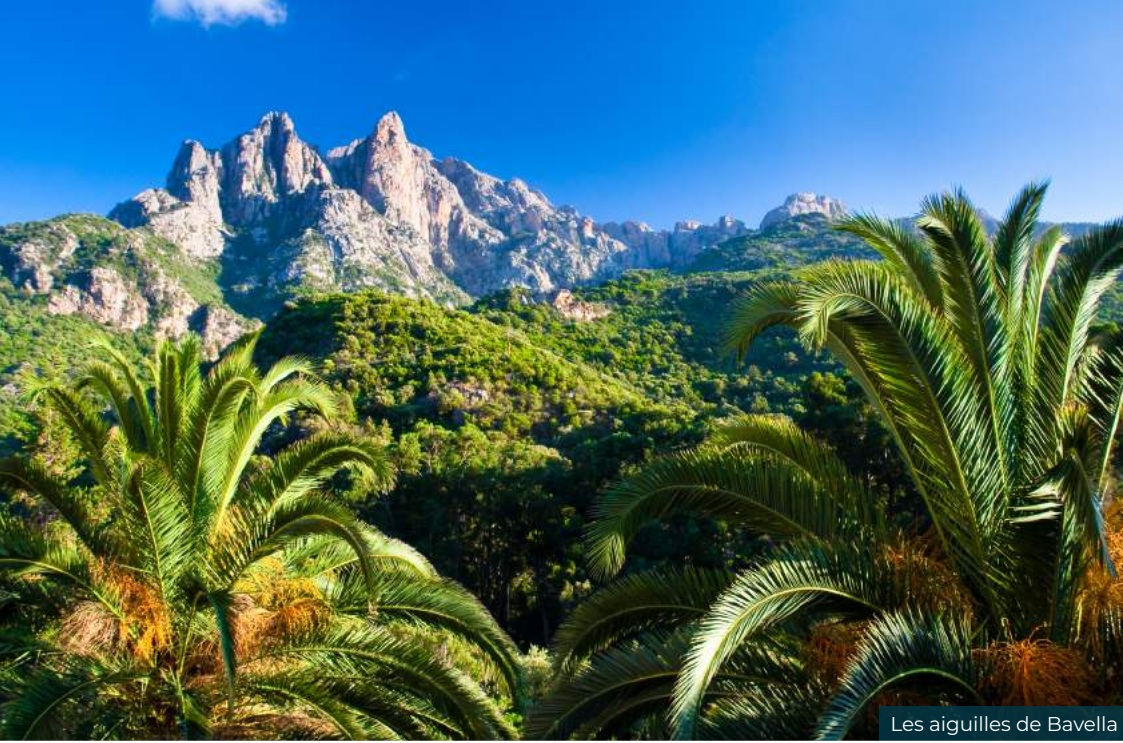
Les aiguilles de Bavella