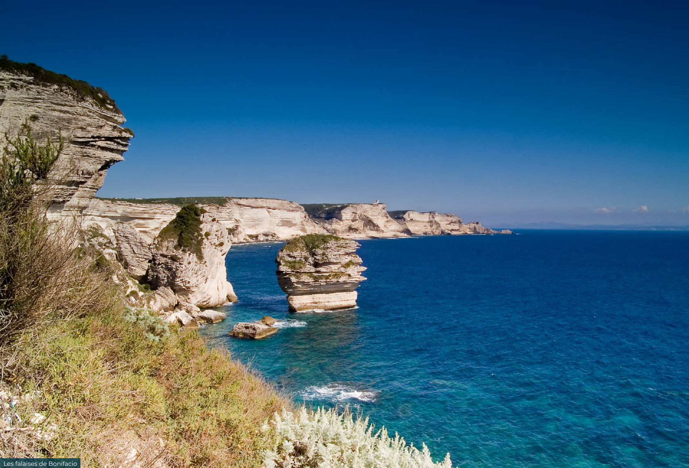
Les falaises de Bonifacio