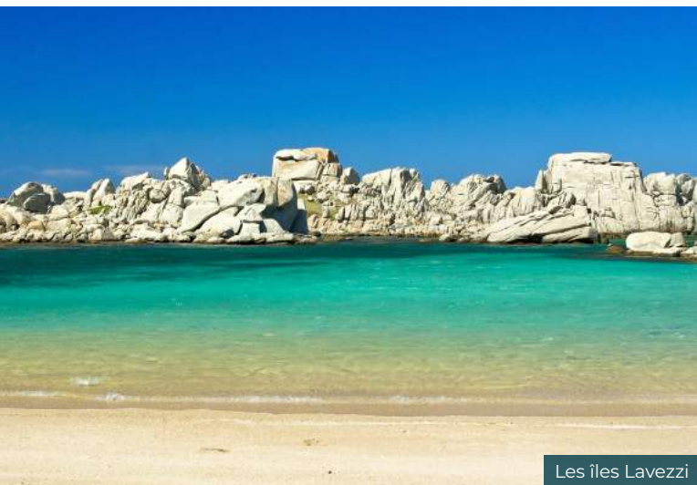
Les îles Lavezzi