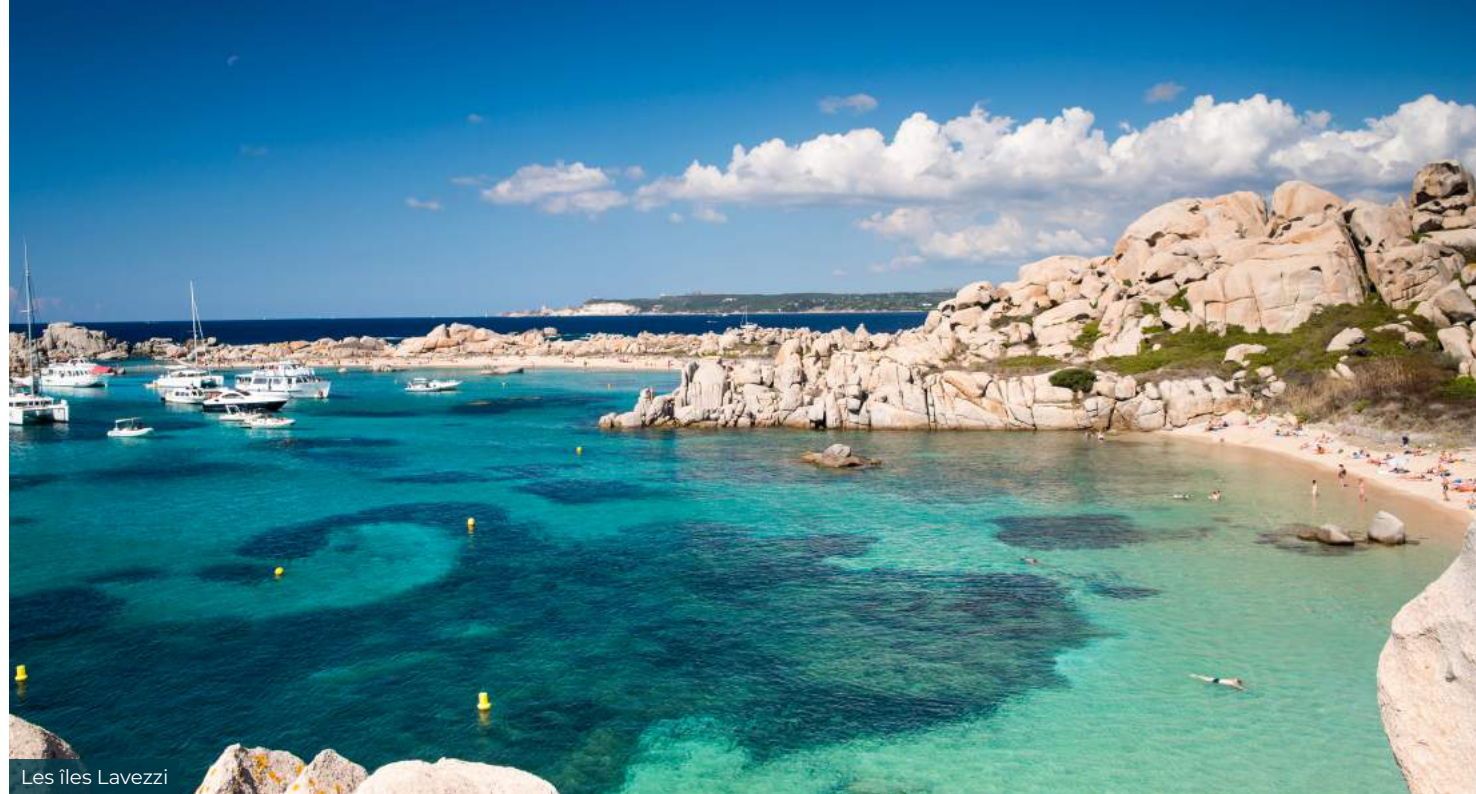
Les îles Lavezzi

01.55.20.90.90, 9H-20H, 7 jours sur 7 www.catlante.com