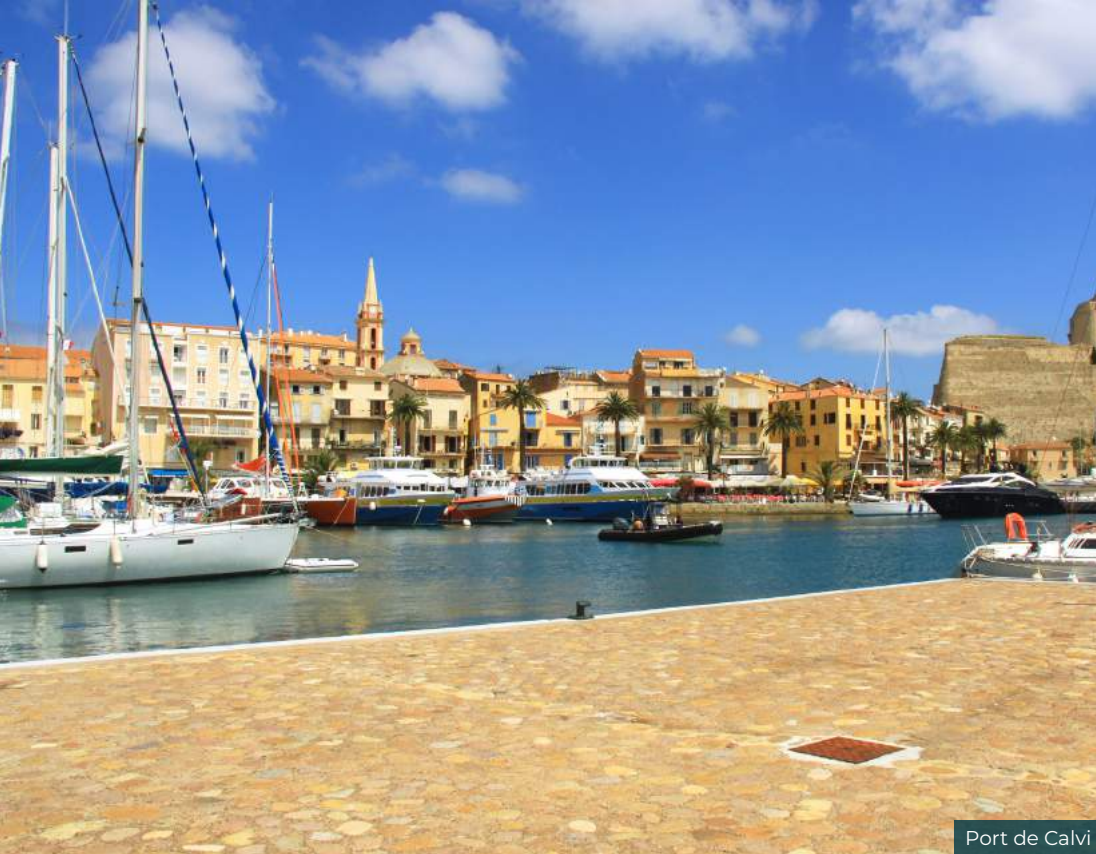
Port de Calvi