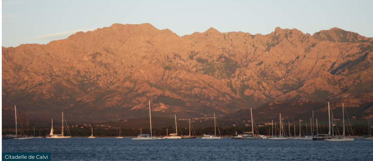
Citadelle de Calvi

Aujourd'hui, le Capitaine vous emmène à l'île Rousse (navigation 1h30). Vous découvrirez alors le nord-ouest de l'île, lieu de farniente par excellence. Ses stations balnéaires et ses multiples plages bordent le maquis des montagnes environnantes et les petits villages perchés sur les promontoires. Vous terminerez la journée soit dans la Baie d'Acciolu (navigation 1h 30) pour voir le désert des Agriates, immensité de crêtes, vallons et sommets rocheux, tournés vers la mer et le Cap Corse, ou à la plage de Saleccia, véritable merveille avec son eau limpide et son long bandeau de sable blanc. Dîner et nuit au mouillage