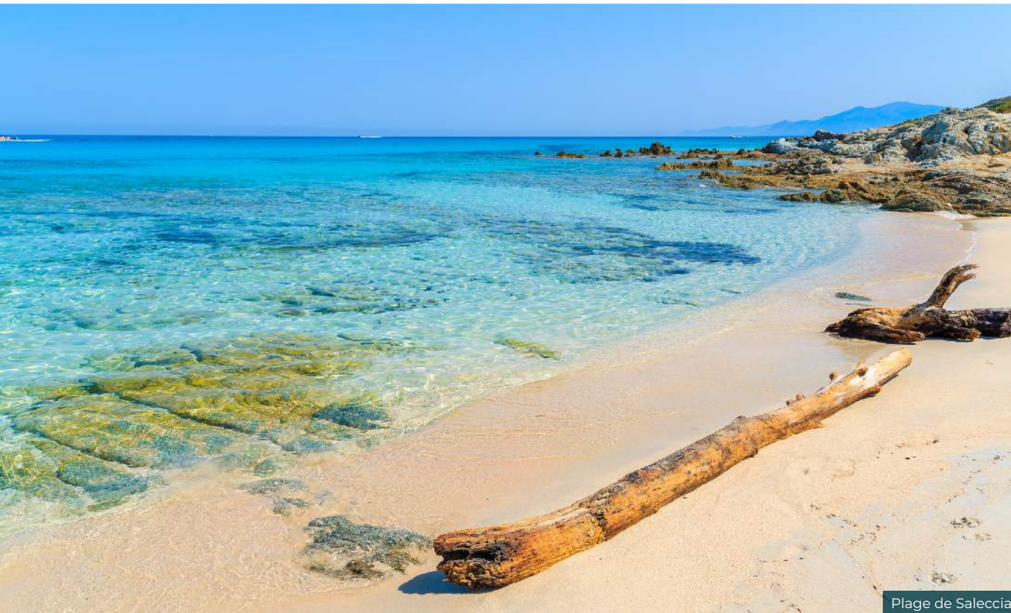
Plage de Saleccia