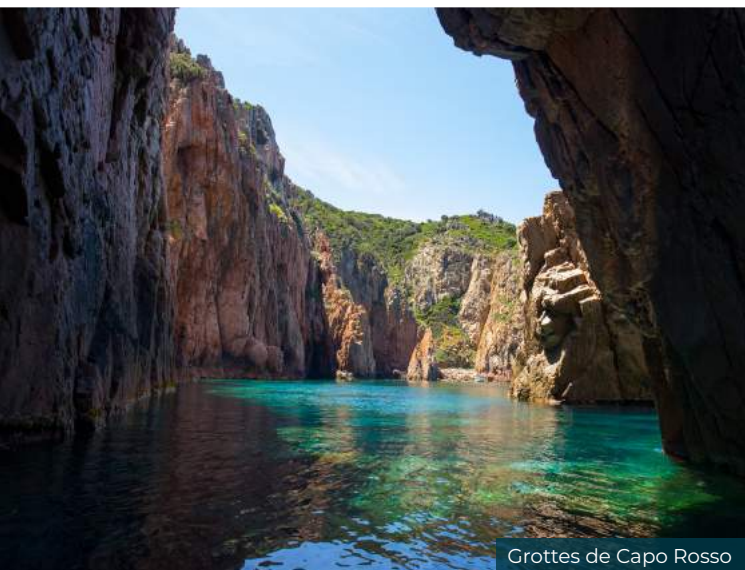
Grottes de Capo Rosso