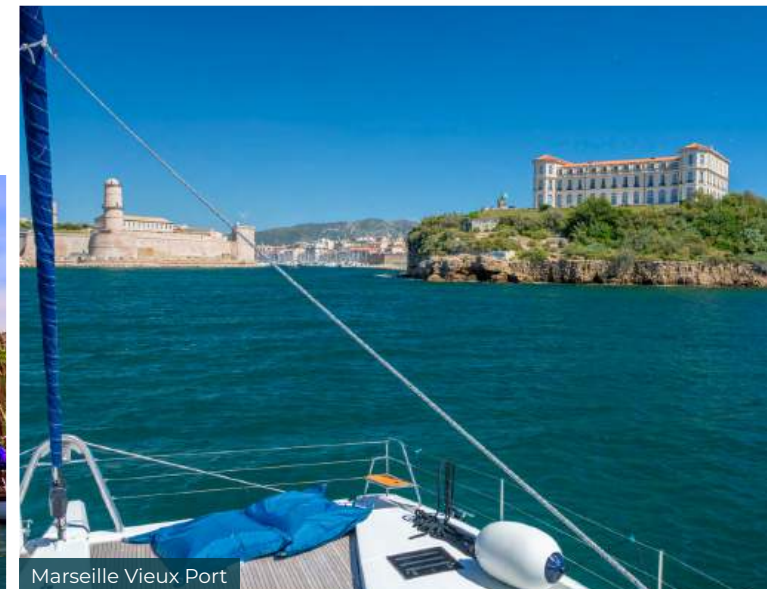
Marseille Vieux Port