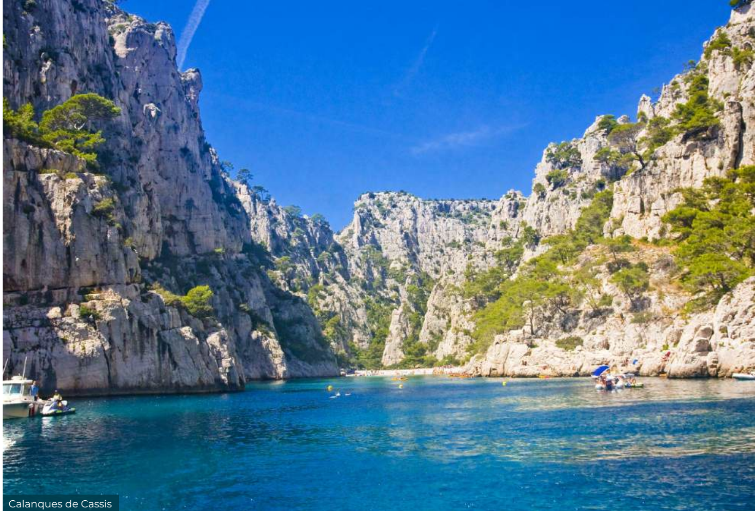
Calanques de Cassis