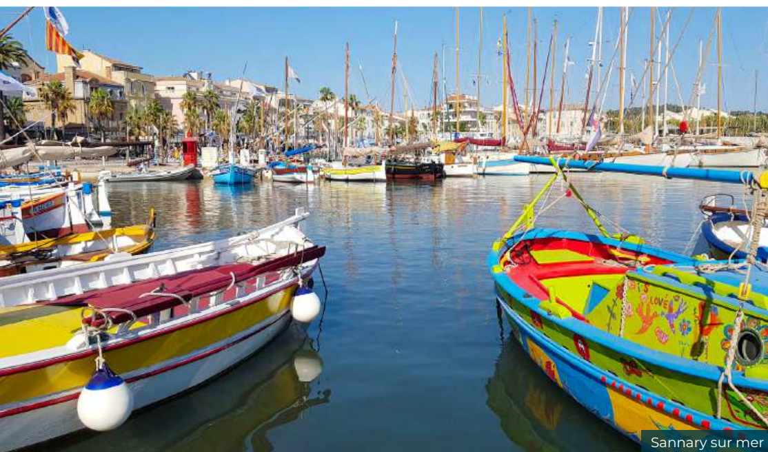
Sannary sur mer