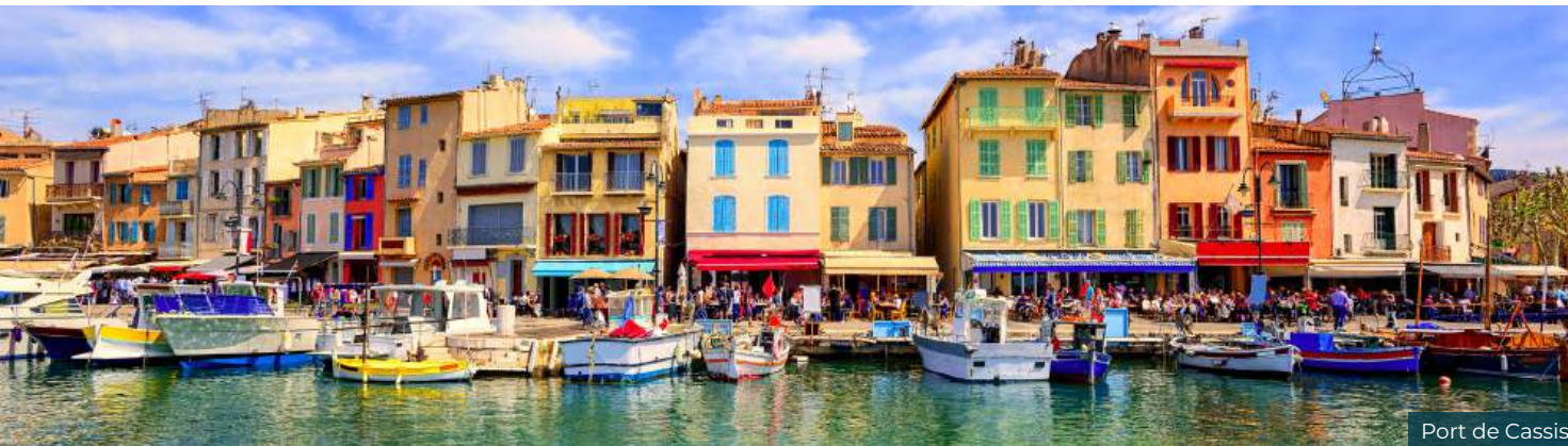
Port de Cassis