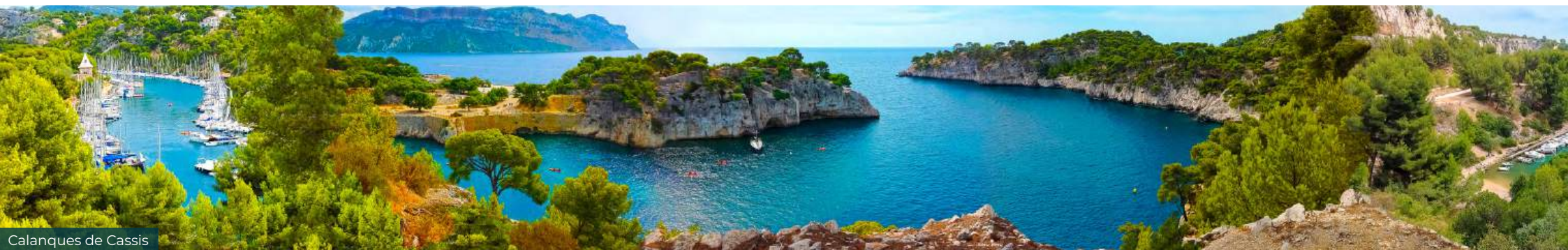
Calanques de Cassis