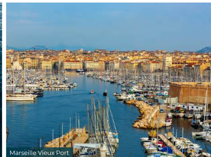
Marseille Vieux Port