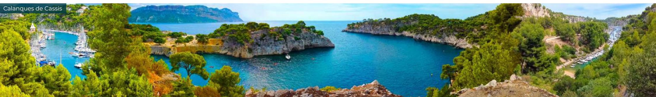
Calanques de Cassis