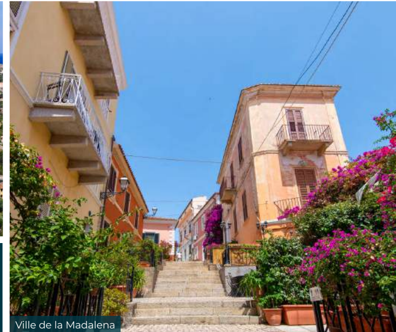
Ville de la Madalena