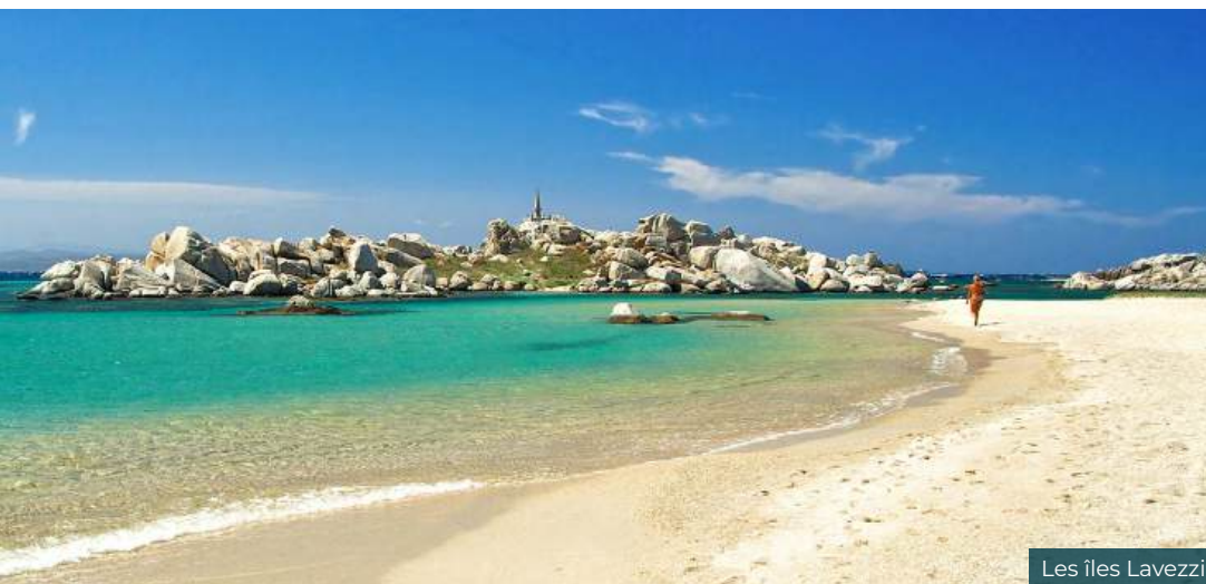
Les îles Lavezzi

En matinée vous longerez les falaises blanches du sud de la Corse, puis vous remonterez la côte ouest vers le nord pour jeter l'ancre au pied du fameux Lion de Roccapina, gardien d'une anse merveilleuse : eau bleu lagon, pins parasols et sable blanc. Avec son petit port de pêche, ses quelques maisons tournées vers la mer et son atmosphère paisible, Tizzano incarne une Corse encore discrète, où le temps semble s'écouler un peu plus lentement. Dîner et nuit au mouillage.