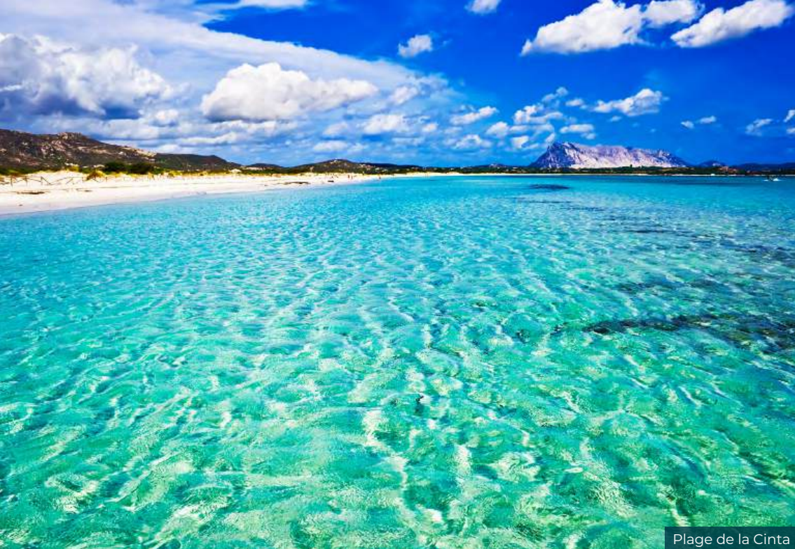
Plage de la Cinta