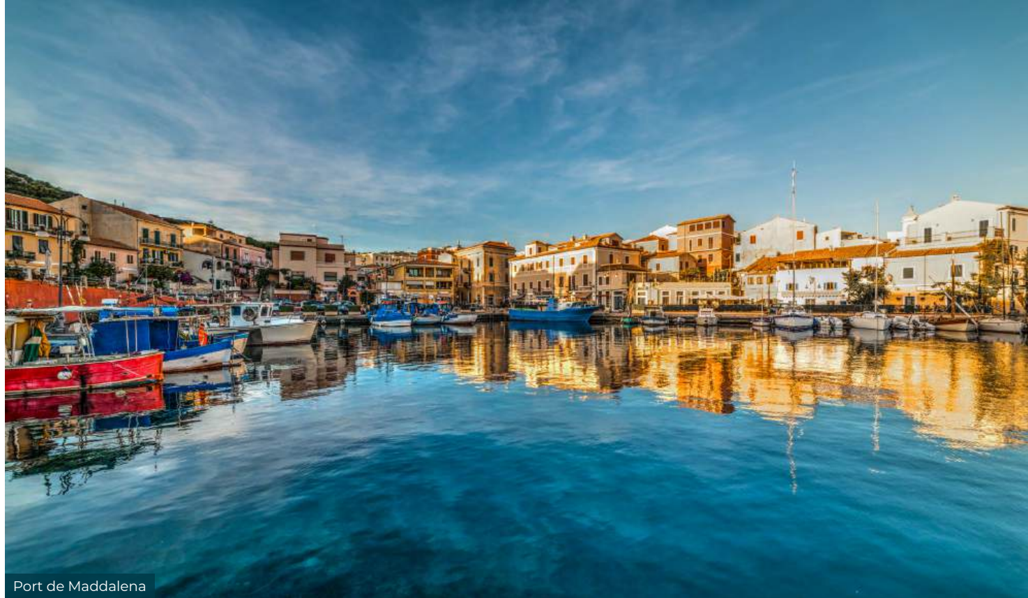
Port de Maddalena

Puis viendra la Corse du Sud. Les falaises de Bonifacio, les plages de l'île Piana, le Lion de Roccapina et les eaux paisibles du golfe de Valinco composeront la seconde partie de votre voyage. Une semaine seulement, mais une immersion complète entre deux des plus belles îles de Méditerranée, où chaque journée dévoile une nouvelle facette de la Corse et de la Sardaigne.