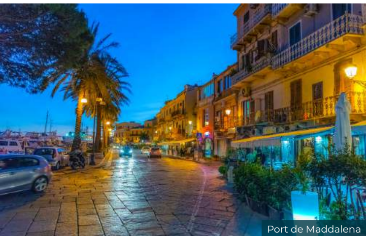
Port de Maddalena